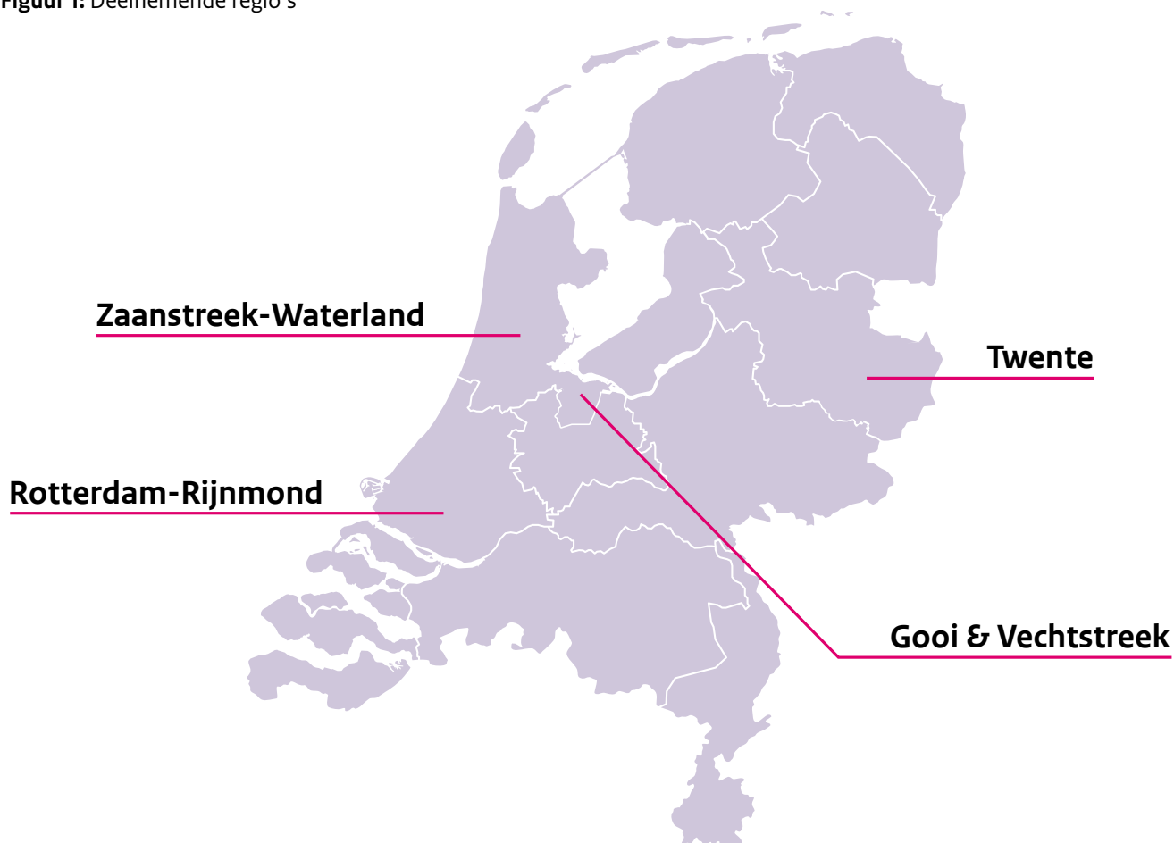
Figuur 1: Deelnemende regio's

Vier regio's werkten aan netwerksamenwerking rond vroegsignalering van alcoholproblematiek bij volwassenen. Door de verschillen in hun lokale/regionale situatie kozen zij elk voor een eigen aanpak. Hierna delen de regio's met wie zij samenwerkten, wat ze hebben gedaan, en wat ze hiervan hebben geleerd.